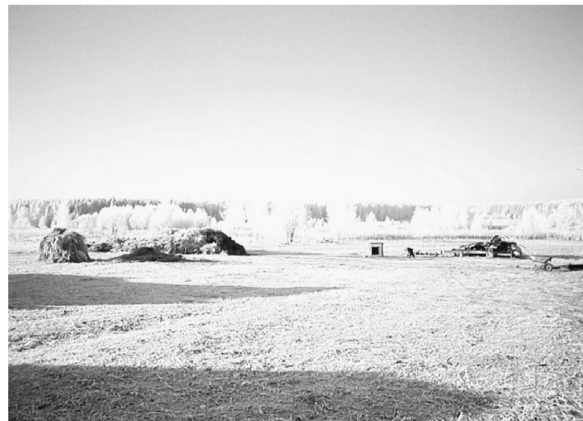
База хозяйства. Еще летом прошлого года здесь был лес.