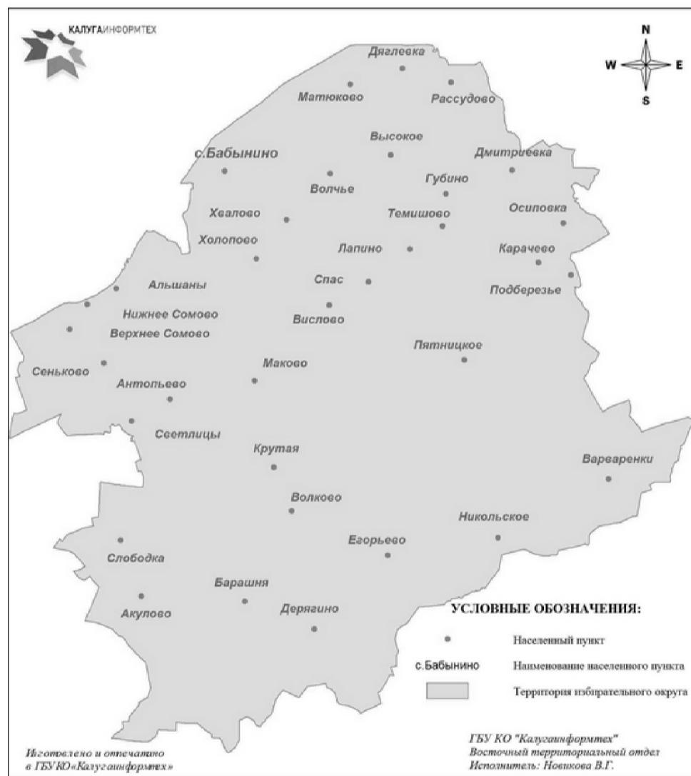
Графическое изображение схемы избирательного округа для проведения выборов депутатов Сельской Думы муниципального образования сельское поселение «Село Бабынино»

Приложение № 2 к решению Сельской Думы муниципального образования сельского поселения «Село Бабынино» № 20-р от 3.12.2014 года