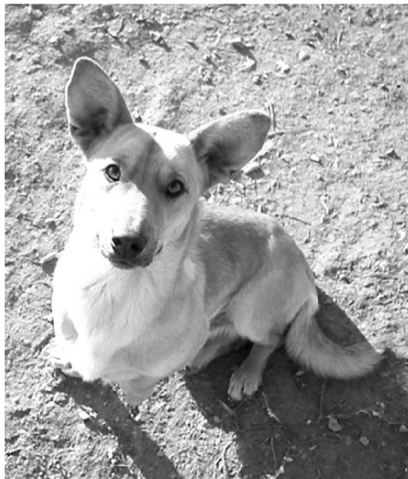
Фунтик – “начальник” охраны КФХ, он же главный загоняла животных на ферму после прогулки.